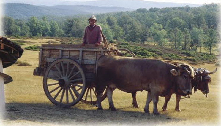
Labores agrícolas en Fontanos de Torío

Desde el siglo XIII, el administrador del Infantado del Torío fue el Abad de San Isidoro de León. Resultado de las malas relaciones entre el Abad y el condado de Luna, el Infantado queda dividido en cuatro Señoríos, el del Abad de San Isidoro, el del Conde Luna, el del Deán y Cabildo Catedralicio y el de Garrafe, llenando estos pagos de casas blasonadas, algunas que aún hoy se conservan.