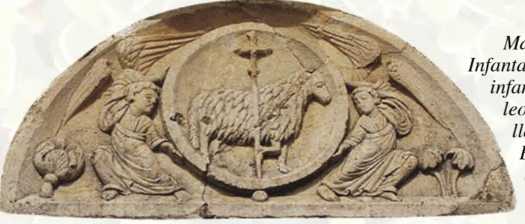
Tímpano románico del antiguo monasterio de Ruiforco