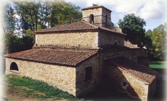
Santuario de Ntra. Sra. de Manzaneda