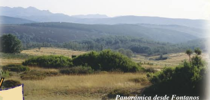
Panorámica desde Fontanos