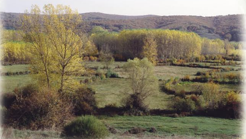
Prados en la vega del Torío

Por el Valle Viceo, que comunica las cuencas del Bernesga y del Torío, la ruta llega a Matueca de Torío, donde se cruza la carretera para llegar al puente del vivero forestal de la Diputación de León.