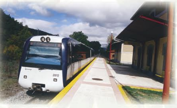
Estación de Pedrún

Pueblo a pueblo, paralelo al Torío, el tren hullero, es paso de ida y vuelta diario para viajeros y paseantes, entre los valles mineros del Bernesga, Torío y Curueño y la capital leonesa.