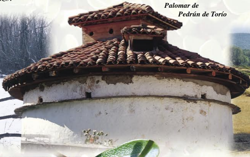
Palomar de Pedrún de Torío

Más tarde, Ramiro II organizó el Infantado del Torío, destinado a las infantas, las hijas de los reyes asturleonese. Ocupaba toda la ribera y llegaba hasta el puente de Pardavé. El Infantado del Torío pertenecía al alfoz de León y sus vecinos disfrutaban de los mismos derechos que los ciudadanos que vivían en el interior de las murallas de la ciudad.