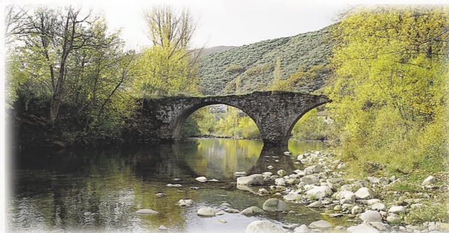
Río Torío y puente de Villalfeide

Los montes y laderas que flanquean el Torío están cubiertas por un espeso manto de robles melojos. Estos bosques permanecen verdes en verano, y en otoño tienen las laderas con tonalidades pardas de hojas secas, que permanecen en las ramas hasta