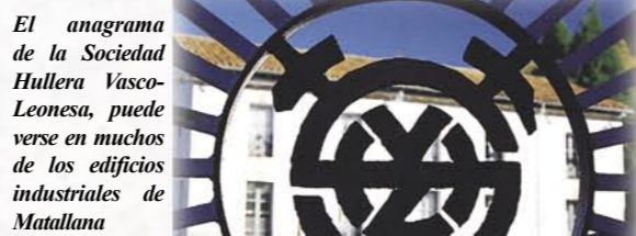
El anagrama de la Sociedad Hullera Vasco-Leonesa, puede verse en muchos de los edificios industriales de Matallana

La ruta se dirige a Serrilla, desde donde se toma el camino de vuelta. Si el tramo de ida se caracterizaba por mostrar la faceta industrial y minera del municipio de Matallana, el de regreso a la estación muestra su lado más tradicional, recorriendo las huertas y los fértiles prados de siega de la vega del río. Se atraviesa también un interesante monte de roble melojo antes de llegar a la ermita de San Roque, desde donde solo queda volver al punto de inicio.