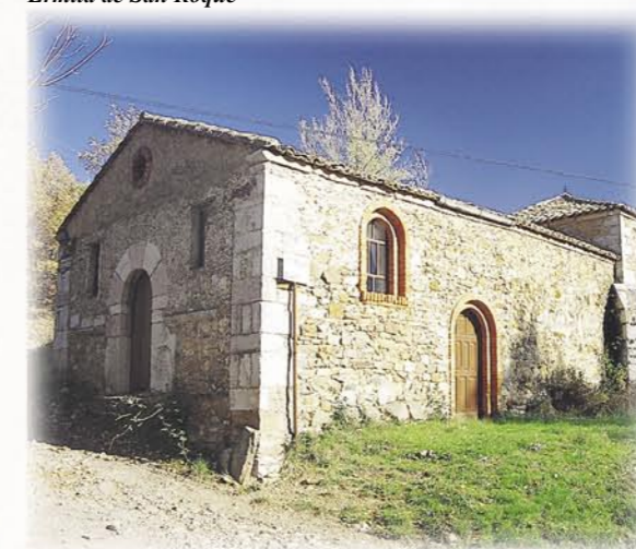
Ermita de San Roque

industrial de la primera mitad del siglo XX. Esta mezcla arquitectónica confiere a estos pueblos un carácter único.