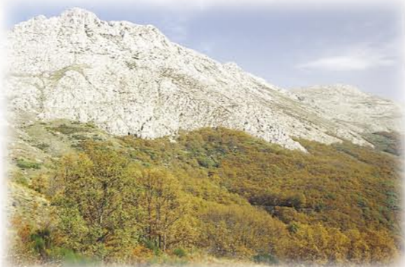
Los robles cubren hoy las laderas en las que se situaba la mina Bardaya