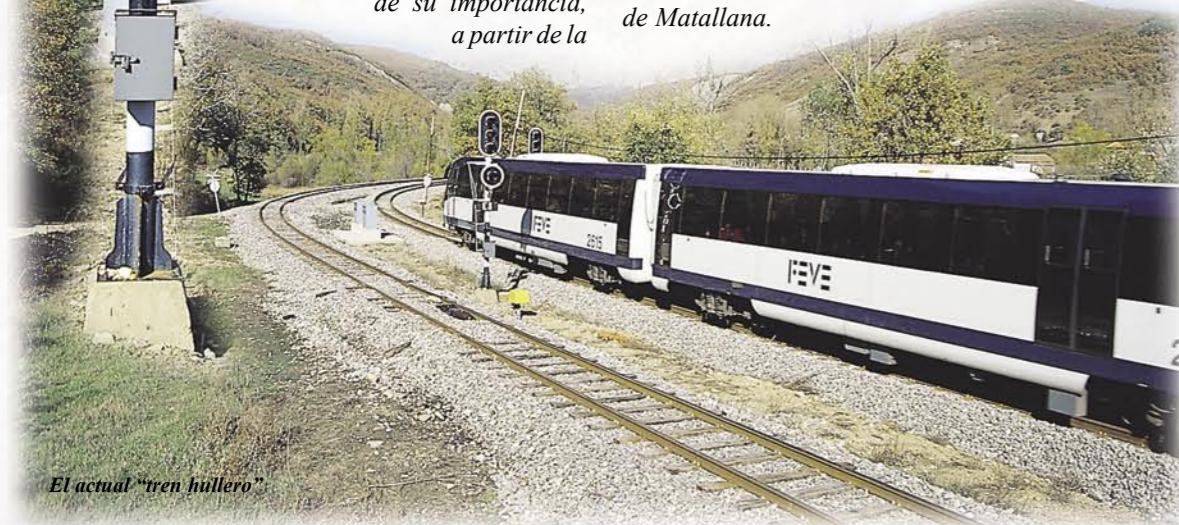
El actual "tren hullero"

Una de las minas más importantes de Matallana fue la Mina Bardaya, explotada por la Sociedad Hullera Vasco-Leonesa. En los años cincuenta, trabajaban en sus galerías en torno a 500 trabajadores. La vía Bardaya llevaba la hulla directamente desde la mina hasta la estación de Matallana.