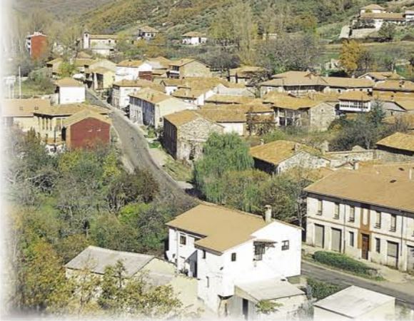
Matallana de Torío

Descripción de la ruta RUTA COMPLETA: 9,5 Km. 3:15 horas DIFICULTAD: baja RECOMENDACIONES: