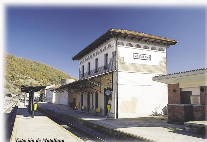
Estación de Matallana

crisis energética de los años setenta, cuando el carbón de la zona dejó de emplearse en el País Vasco y comenzó a ser utilizado principalmente en la alimentación del grupo termoeléctrico de La Robla.