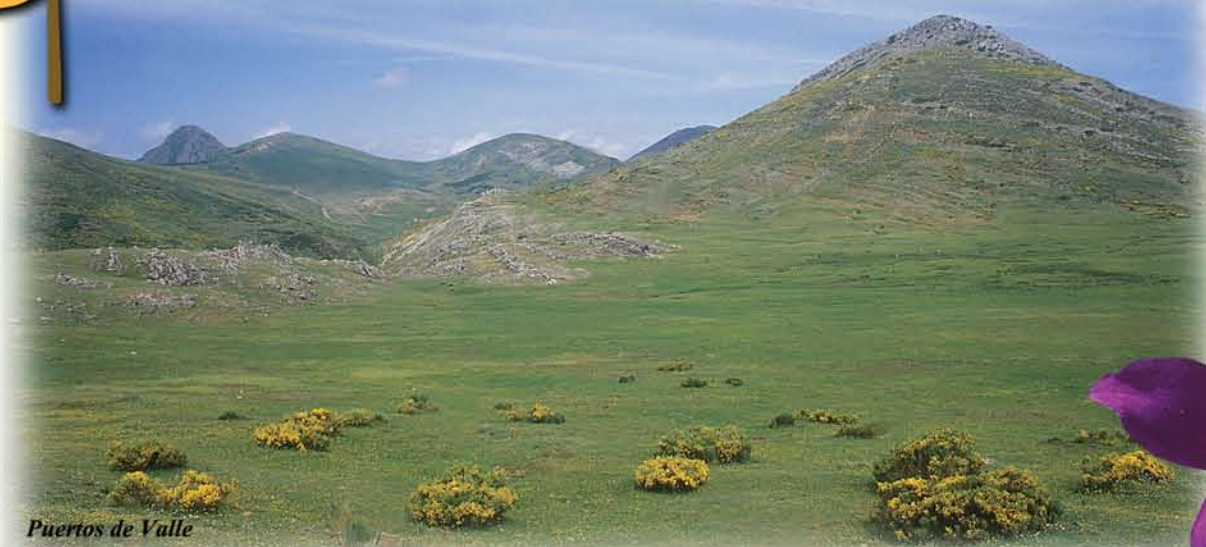
Puertos de Valle

Cuando se va retirando la nieve y los prados manifiestan todo su frescor, una amplia variedad de plantas herbáceas inician la floración, convirtiendo los pastizales en una de las comunidades más complejas y vistosas de la montaña. Duran poco, apenas el tiempo de exhibir unas vistosas flores, gracias a lo que son polinizadas por los insectos, garantizando así su supervivencia.