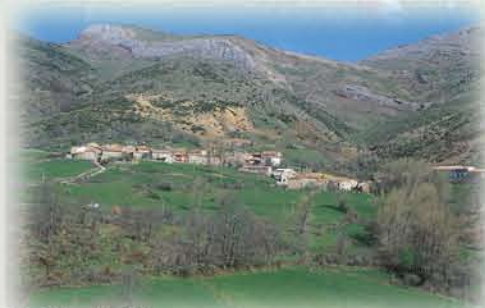
Valle de Vegacervera

En el camino de San Salvador de Oviedo, uno de los ramales del Camino de Santiago, Coladilla custodia con esmero el encanto de los pueblos de la montaña. Un puñado de casas se agrupan en torno a su iglesia de traza románica, una joya por descubrir.