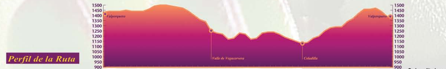
Perfil de la Ruta