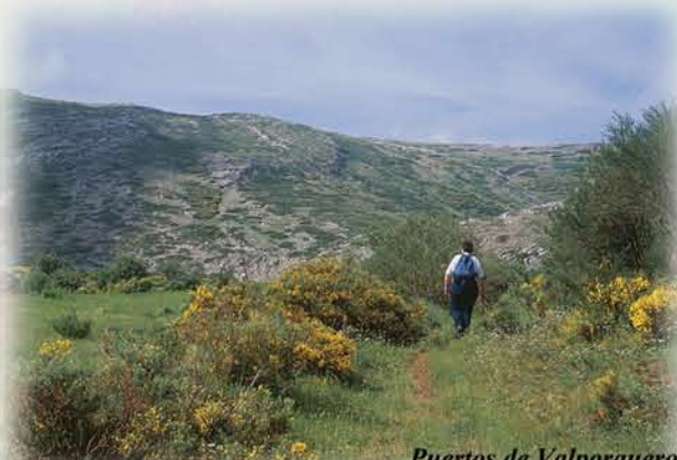
Puertos de Valporquero

Las amplias vegas de Valporquero, o parajes como Las Monecas, eran aprovechados a guadaña, segando y almacenando la hierba para que pudiera servir de alimento al ganado durante el invierno.