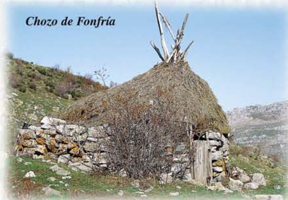
Chozo de Fonfría

La historia de Sancenas es la de la trashumancia. Las ovejas merinas que venían en verano de la lejana Extremadura, dejaron en estos puertos un legado cultural y etnográfico que todavía está presente en los pueblos de la comarca.