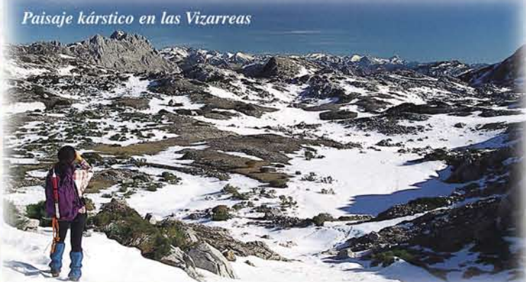
Paisaje kárstico en las Vizarras

El agua de las precipitaciones disuelve lentamente el carbonato cálcico de la roca, conformando un extraño paisaje plagado de hoyos o dolinas que tienen su correspondencia en extensas cuevas y ríos subterráneos en el interior de las montañas.