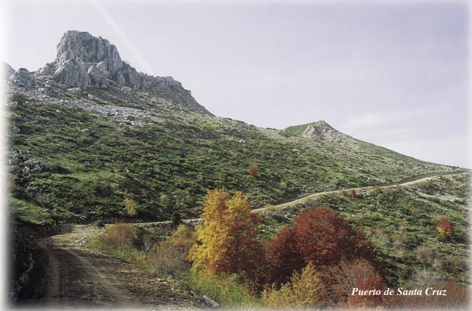
Puerto de Santa Cruz

La ruta se inicia en Cabornera, en el puente que cruza el río Casares y se dirige con una ligera ascensión a la hoz del Calero, enclave de singular belleza por el que se transita sobre un empedrado, destinado a conservar el camino en buenas condiciones en caso de avenidas torrenciales, por la angosta garganta que forman los afloramientos calizos. El camino continúa ascendiendo hasta llegar al puerto de Fonfrea primero y al Espineo después. Durante la ascensión, la cordillera Cantábrica ofrece paisajes con todo su esplendor. Finalmente se llega al puerto de Santa Cruz, donde hay una majada y un aprisco para el ganado.