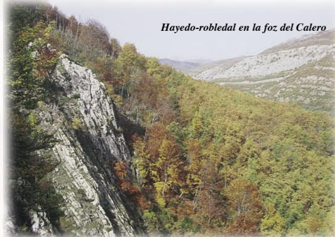
Hayedo-robledal en la foz del Calero

Desde Santa Cruz se siguen varias veredas que permiten acceder a Foz Escura, una impresionante hoz entre cuyas paredes aún quedan los restos de los antiguos chozos empleados por los pastores para refugiarse. La ruta prosigue por una senda que ocasionalmente se pierde entre los canchales, hasta conducir al caminante al interior de un hayedo de gran belleza y alto valor ecológico. Poco a poco se va descendiendo hasta llegar a la carretera de Aralla, que será necesario dejar atrás, para subir por una estrecha carretera de montaña hasta Paradilla de Gordón.