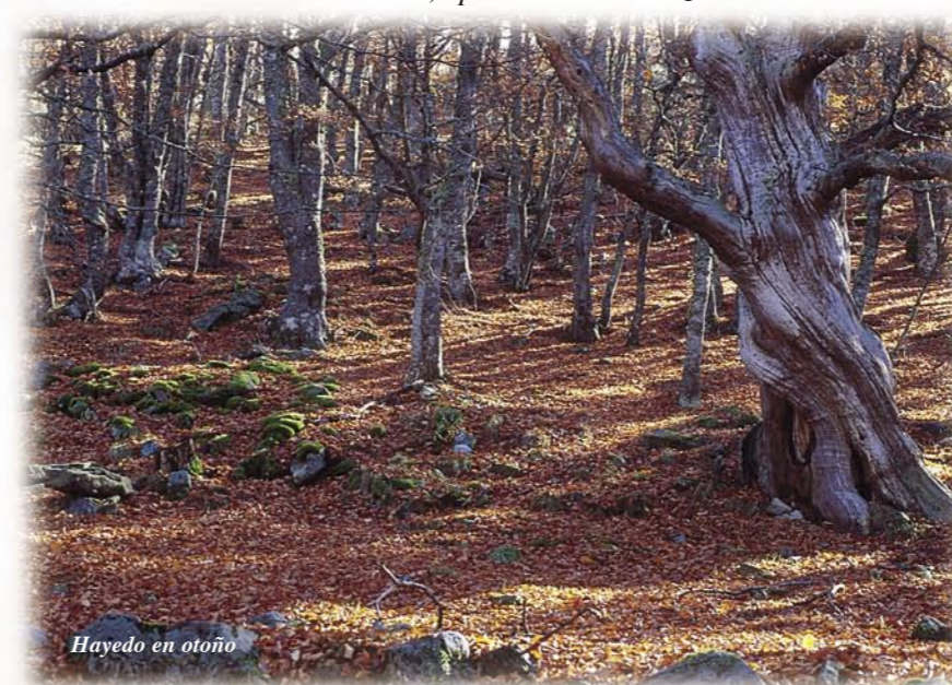
Hayedo en otoño

El hayedo, al contrario que el sabinar tiene unos requerimientos de humedad bastante altos, por lo que suele asentarse en las laderas de exposición norte.