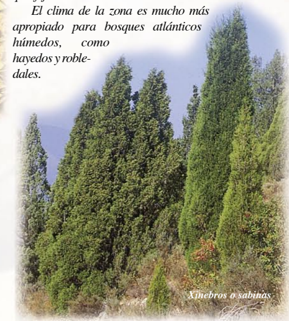
Xinebros o sabinas

El clima de la zona es mucho más apropiado para bosques atlánticos húmedos, como hayedos y robledales.