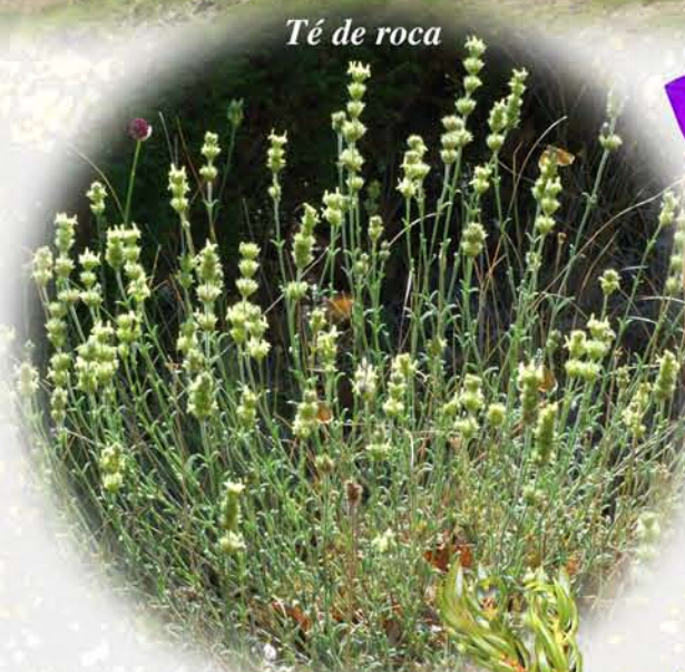
Té de roca

Observar en detalle la vegetación de un lugar permite conocer aspectos interesantes de su litología. En las cumbres erosionadas de estos cordales calizos, sobre piedras muy fragmentadas, crece el té de roca y el árnica, así como tupidas matitas leñosas de Astragalus. A ras de suelo, conformando un denso tapiz que apenas levanta unos cuantos centímetros para soportar mejor la ventisca montana, crecen lustrosas gayubas, punzantes enebros alpinos y sabinas rastreas, indiferentes a la composición del sustrato. El melojar por fin, delata la naturaleza silíceo de las rocas de las cotas inferiores del Fontañán; en sus márgenes y claros prosperan rosadas urces y qui-ruelas, o amarillos piornos y escobas, propios de suelos ácidos.