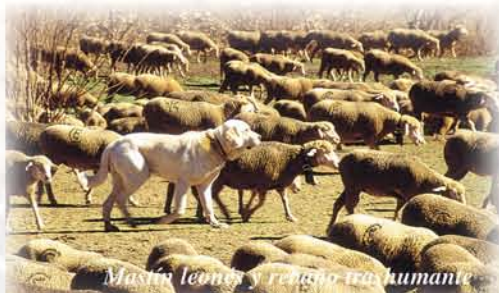
Masón leonés y rebaño trashumante

Abeltas ha sido desde siempre uno de los pueblos con mayor tradición trashumante de la montaña leonesa. De hecho, es uno de los pocos a los que aún llegan rebaños de merinas año tras año. No obstante, lejos quedan los días en los que sus pastos acogían cada verano a varios rebaños y estaba a la