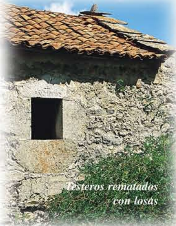
Testeros rematados con losas

El relativo aislamiento de Abeltas, ha supuesto que perduren las construcciones propias de la zona hasta nuestros días. Aún así, se han perdido algunos detalles como las cubiertas de teito, a base de cuernos de centeno, aunque se mantienen los testeros rematados con piedras escalonadas, propias de este tipo de cubierta.