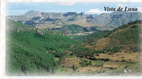
Vista de Luna

temporada sobrepasaban los 12.000 reales. También fue cuna de afamados mayores que fueron los depositarios de los conocimientos y las costumbres ganaderas y los encargados de transmitirlos a las generaciones siguientes. A los