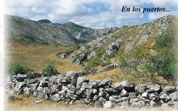
En los puertos...

cabeza en cuanto a ingresos procedentes de arriendo de los puertos, que cada