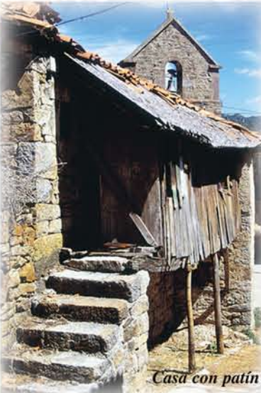
Casa con patín

Las casas con escalera o patín exterior, propias de Luna y de los Argüellos, tiene en Abeltas la peculiaridad de presentar el descansillo de la escalera cerrado y apoyado en el suelo con postes de madera.