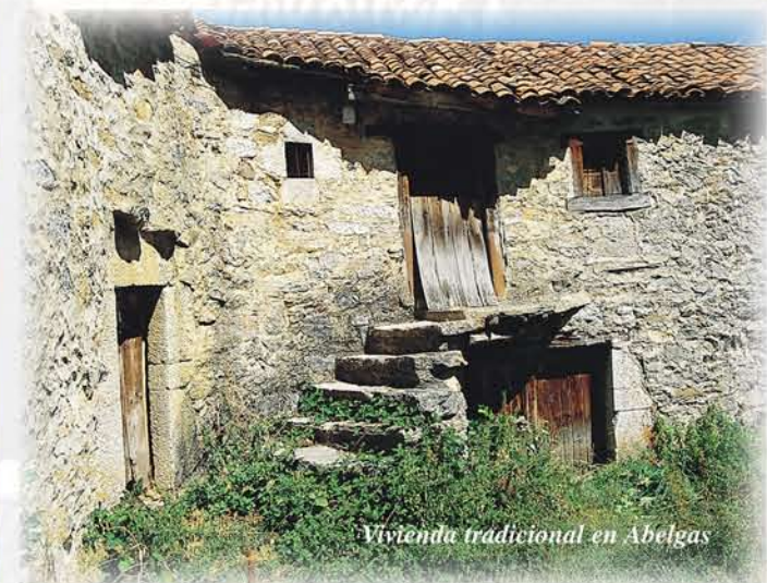
Vivienda tradicional en Abeltas

Las casas con escalera o patín exterior, propias de Luna y de los Argüellos, tiene en Abeltas la peculiaridad de presentar el descansillo de la escalera cerrado y apoyado en el suelo con postes de madera.