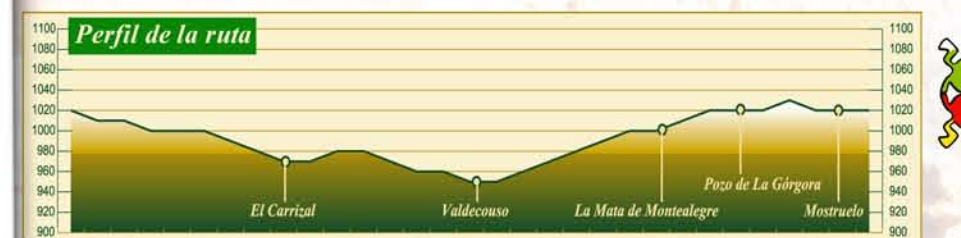
Se ha editado un folleto con información detallada sobre la ruta, disponible en CUATRO VALLES