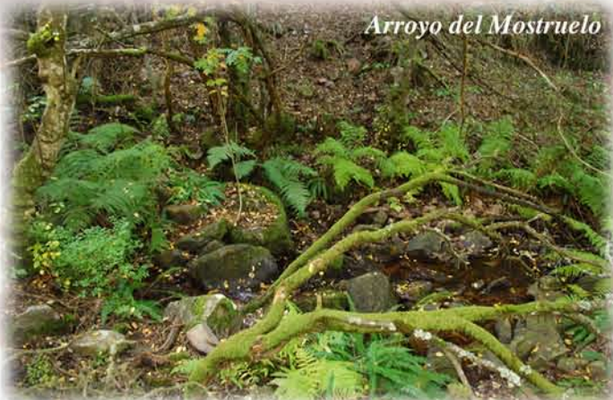
Arroyo del Mostruelo