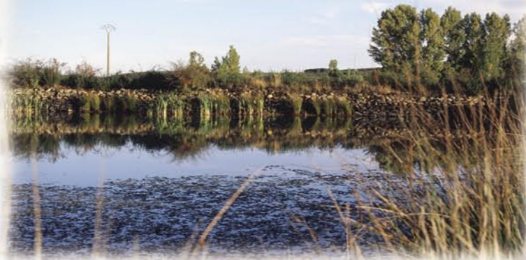
Embalse de "La Raldona"

y de las labores cotidianas, propició la participación del vecindario en trabajos comunitarios que resultaban imprescindibles para el bien de todos.