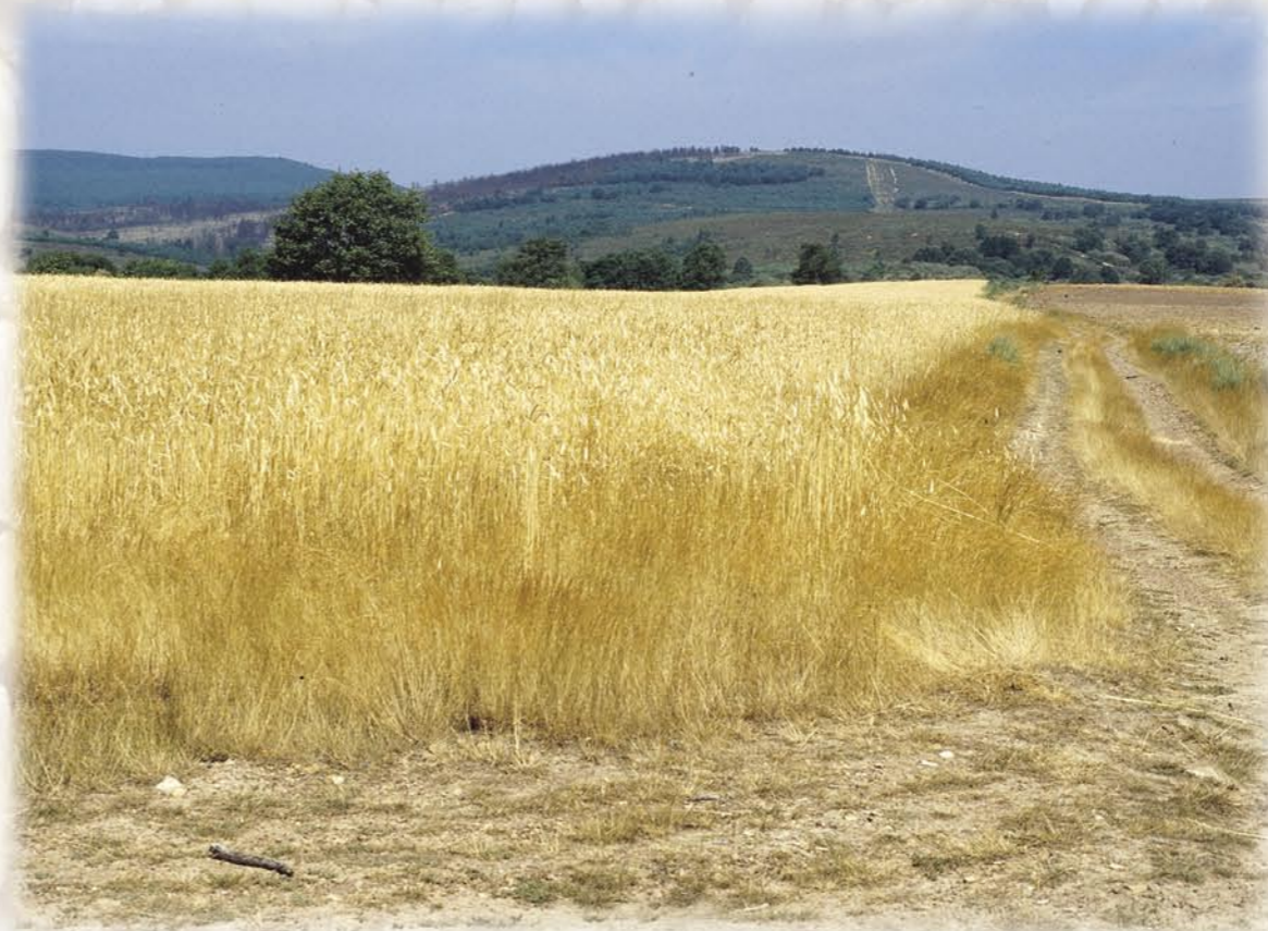
Vista del Celemín y tierras centenales

Punto elevado en la comarca, el Celemín alcanza los 1.136 m de altitud y da nombre a la ruta. Palabra de origen árabe, el celemín es una medida antigua de volumen y superficie. Aunque los valores cambian de un lugar a otro, en general, la medida de capacidad para áridos equivale a 4,625 litros y la de superficie a 537 metros cuadrados, el espacio de terreno necesario para sembrar un celemín de trigo.