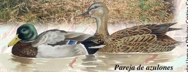
Pareja de azulones