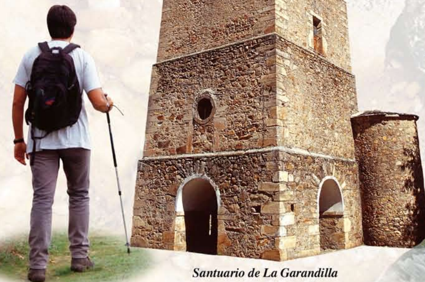
Santuario de La Garandilla

Precisamente de esta época se conserva en el Museo Diocesano de la Catedral de León una virgen románica que podría ser la imagen reverenciada originalmente en La Garandilla.