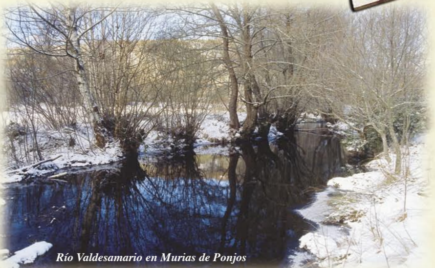
Río Valdesamario en Murias de Ponjos

Desde la Utrera y desde Paladín se puede acceder al puente colgante. Allí, una tranquila tabla del río es el lugar más adecuado para el baño.