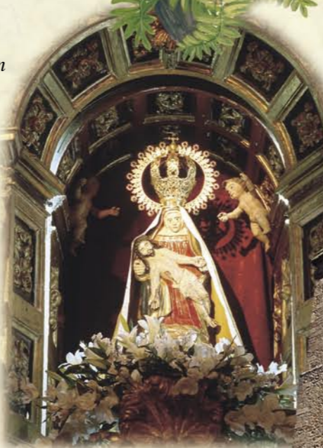
Nª Sra. de La Garandilla