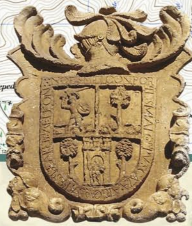
Base cartográfica propiedad Instituto Geográfico Nacional - Centro Nacional de Información Geográfica. Hojas 128-IV Valdesamario y 128-III Espina de Tremor. Monte de Utilidad Pública nº 252, Valdesamario.