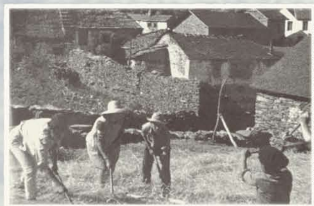
Secanos y vegas

Aunque apenas han llegado evidencias hasta nosotros, el poblamiento de Omaña es antiguo. Algunos restos arqueológicos hablan de pobladores prerromanos que vivían en castros encaramados en laderas soleadas o de los avatares sufridos durante la edad media por los señores de estas tierras y con ellos sus posesiones y sus siervos. Los restos del castillo de Trascastro son sin duda, un singular ejemplo.