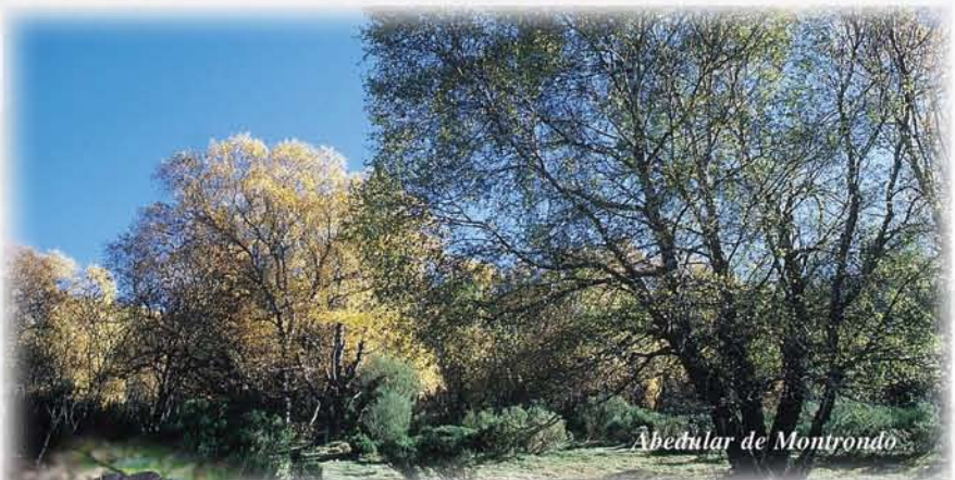
Abedular de Montrondo

Los valles del alto Omaña albergan algunos de los bosques de abedul mejor conservados de la península Ibérica. La ruta permite aproximarse a algunos de ellos, como el de Montrondo y el del valle del Fasgarón, donde se descubrirá su belleza encantada, que se realza en otoño, cuando su esplendor veraniego se va tornando en amarillos y ocre, contrastando con los intensos tonos rojizos de las arandaneras que tapizan el suelo.