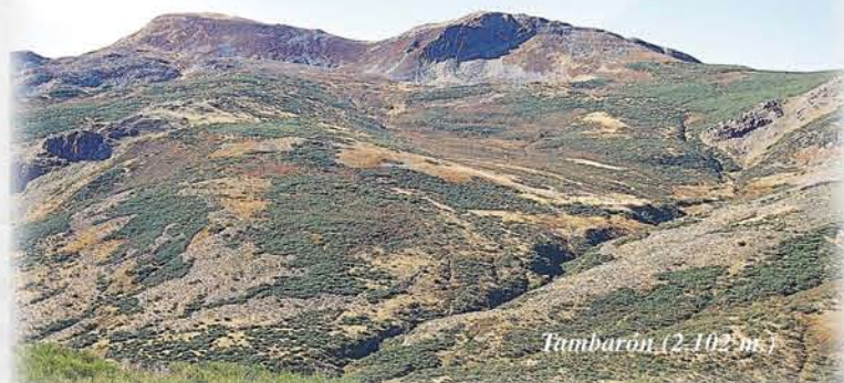
Tambarón (2.102 m.)

Desde la ruta puede iniciarse la ascensión al pico Tambarón (2.102 m.), el más alto de un macizo montañoso en el que casi una decena de picos que superan los 2.000 m. y separan la cuenca del Omaña de la del Alto Sil. La naturaleza de la roca, de tipo silíceo, determina un tipo de suelo muy ácido colonizado por abedules, arándanos, enebros rastreros... que además, han sido capaces de soportar la elevada altitud media y el intenso uso que el hombre ha hecho tradicionalmente de estas montañas.