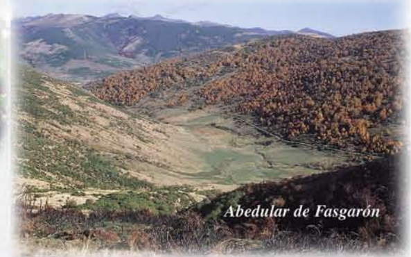
Abedular de Fasgarón