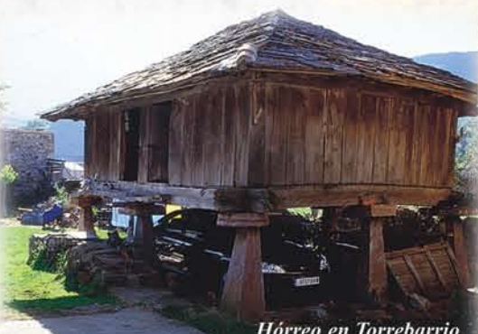
Hórreo en Torrebarrio

los beneficiarios de estos cobros. Torrebarrio ha tenido en tiempos recientes hasta once molinos que han ido cayendo progresivamente en desuso.