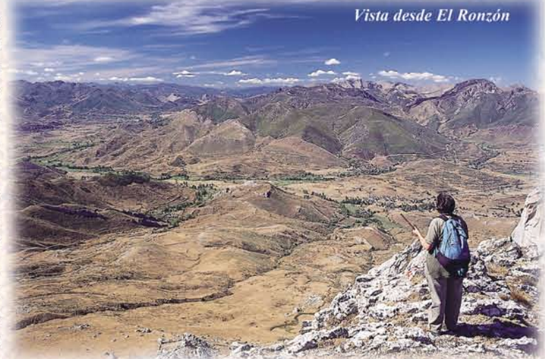
Vista desde El Ronzón

La cumbre de Peña Ubiña se sitúa a 2.411 m. y constituye la máxima elevación de la cordillera Cantábrica. Además de "la Grande", en el macizo de Ubiña se encuentran Ubiña Pequeña, con 2.197 m. y Los Castillines; y todos ellos se localizan a lo largo de unos cinco kilómetros en los que sólo se baja de los dos mil metros en el Collado del Ronzón. El macizo de Ubiña ha sido modelado por una intensa actividad glaciar, aunque algunas de las señales producidas por el hielo han sido progresivamente borradas por la disolución química que el agua de lluvia provoca sobre la roca calcárea. Aún así, se mezclan típicos elementos glaciares, como morrenas o canchales, con estructuras kársticas como las dolinas.