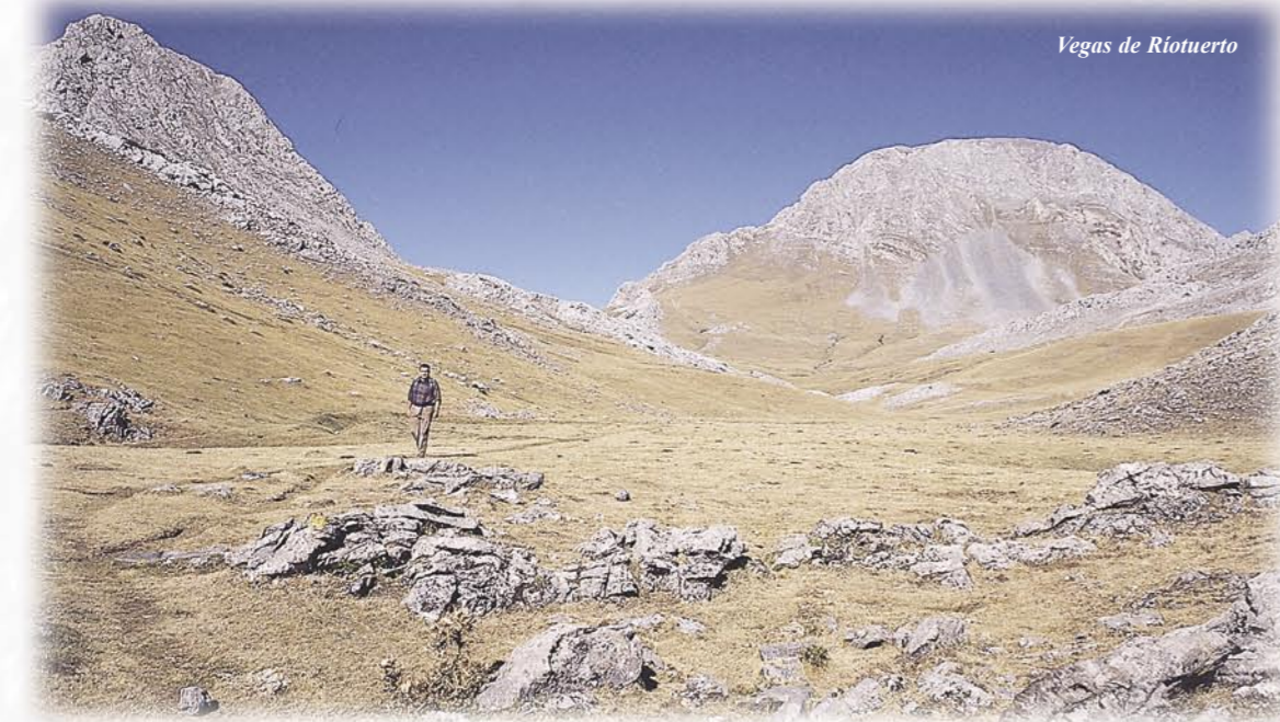
Vegas de Riotuerto