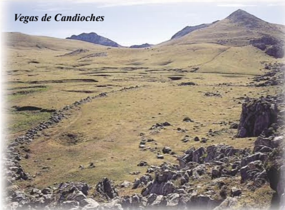
Vegas de Candioches