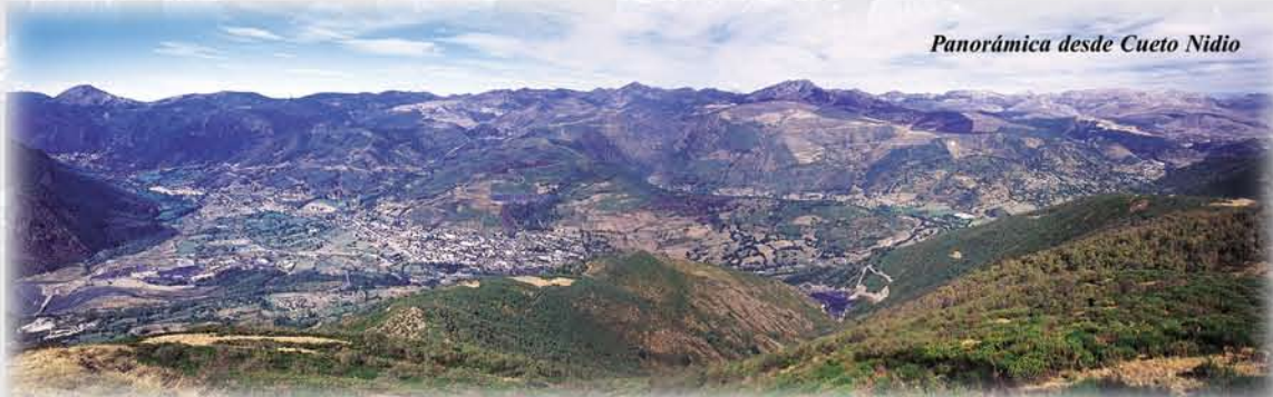
Panorámica desde Cueto Nidido

A pesar de no ser la cima más alta de Laciana, desde los 1.773 metros de Cueto Nidido se contempla la que es, sin duda, la vista más completa del Valle. En los días claros, es posible diferenciar todas las cumbres de las montañas que delimitan la comarca, la mayoría de los pueblos y sus brañas y la sucesión de cubiertas vegetales desde los praderíos de las zonas más elevadas, pasando por los brezales y escobares de las zonas menos elevadas o más castigadas por la deforestación y el fuego, hasta las vegas del Sil donde se asientan los pueblos rodeados