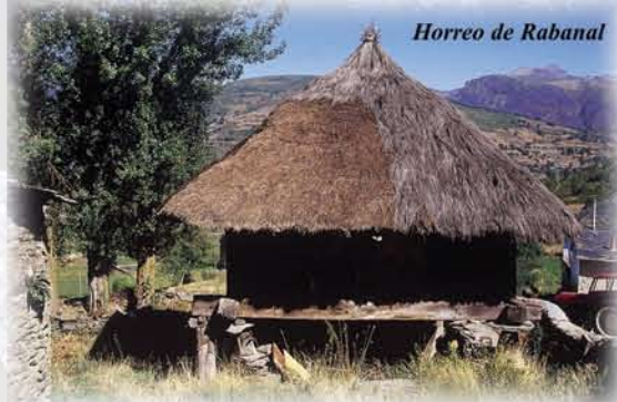
Horreo de Rabanal

tradicional, casas en forma de U, T y L, con todos los elementos alrededor de un corral, la vivienda, las cuadras, las tenadas... y en el centro, el hórreo, como en Rabanal, todavía cubierto de paja de centeno. También en Rabanal se conserva una de las dos lecherías en las que los vecinos recogían y procesaban la leche que se producía en el pueblo y en los aleñados durante el invierno y en las brañas en verano. La manteca y los quesos siguen siendo los productos habituales en la zona. En Rioscuro, familias de linaje como los Arias, dejaron muestras de arquitectura civil en casas blasonadas. El pueblo merece un recorrido tranquilo para descubrir las galerías de madera, las horneras, los soportales o las chimeneas forradas de pizarra.