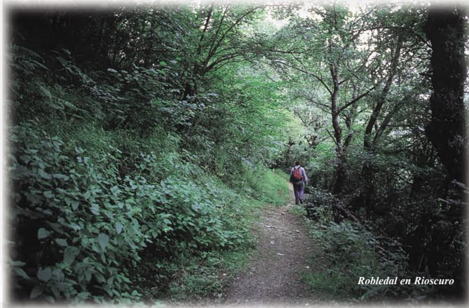
Robledal en Rioscuro

sigue caminos y veredas muy cómodos para el caminante hasta el final del recorrido en Rabanal, no sin haber pasado antes por las inmediaciones del lavadero de carbón de la Minería Siderúrgica de Ponferrada y por el pueblo de Llamas de Laciara.