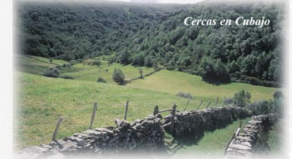
Cercas en Cubajo

ron pueblos de verano o brañas a los que se trasladaban desde finales de verano hasta bien entrado el otoño con toda la familia y sus pertenencias. Los habitantes de las brañas eran conocidos como brañeiros y todo lo que rodea a la braña y al brañeiro constituye una de las manifestaciones culturales más sobresalientes del norte peninsular.