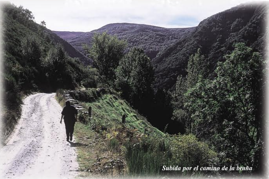
Subida por el camino de la braña

La ruta comienza en Rabanal de Arriba, donde merece la pena darse un pequeño paseo para descubrir su arquitectura tradicional, destacando, un hórreo con techo. El camino abandona el pueblo y comienza un ascenso poco pronunciado, pero continuo, hasta las brañas de Cubajo donde es posible