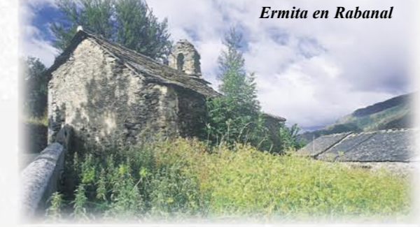
Ermita en Rabanal

Varias son las edificaciones religiosas presentes a lo largo de ruta. En Rabanal aparecen la iglesia del pueblo y una pequeña ermita dedicada a Las Candelas. En Rioscuro, la iglesia de la Asunción muestra su abside románica, con rudos moldurones sin labrar. Posee tres retablos barrocos; según cuentan en el pueblo, el correspondiente al lateral derecho fue tallado a navaja por un lugareño.