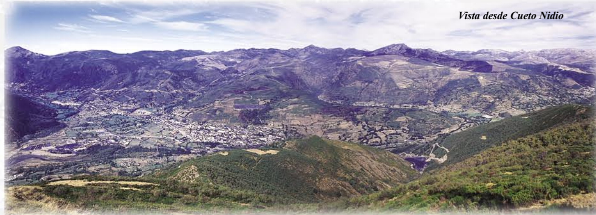
Vista desde Cueto Nidio

idad con interesantes manifestaciones de arquitectura tradicional. En el mismo pueblo se vuelve a cruzar el río ya que el resto de la ruta discurre por su margen izquierda. A partir de aquí, la ruta