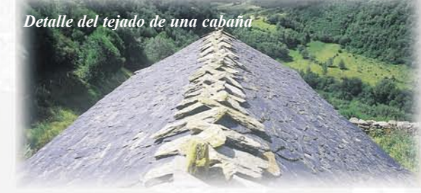
Detalle del tejado de una cabana

que podía estar culminado con piedras más o menos cuidadosamente colocadas o perfectamente engarzadas.