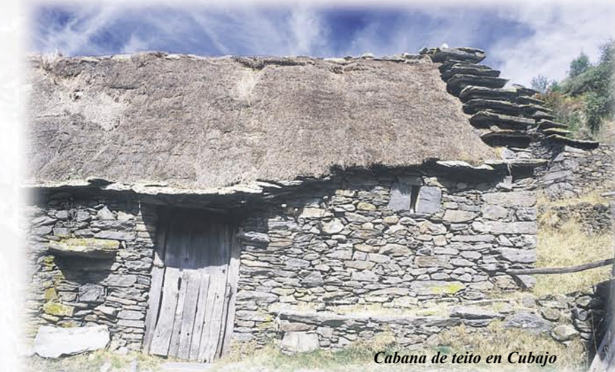
Cabana de teito en Cubajo

Tradicionalmente, el hombre ha tendido a la explotación racional pero intensa de los recursos naturales de cada territorio ocupado. Lógicamente, Laciana no ha sido diferente y así, los fondos de los valles fueron transformados para la creación de pastizales y tierras de labor y