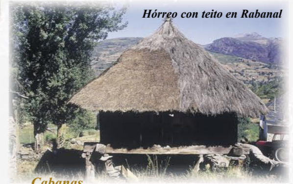
Hórreo con teito en Rabanal

Aunque hoy en día los hórreos tienen un solo propietario, parece que en origen eran comunales.