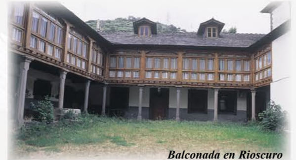
Balconada en Rioscuro