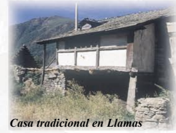
Casa tradicional en Llamas

Aunque cada vez menos comunes, en Llamas de Laciana y Rabanal de Arriba perduran algunas viviendas, hoy generalmente destinadas a pajaros o cuadras, con cubierta vegetal o teito. Aunque el modelo de casa lacianiega se ha presentado como un semicírculo perfecto con un hórreo en el interior, en realidad tienen formas de U, L o T irregulares aunque con las esquinas redondeadas.