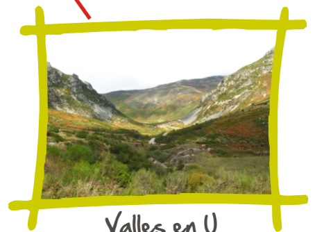
Valles en U